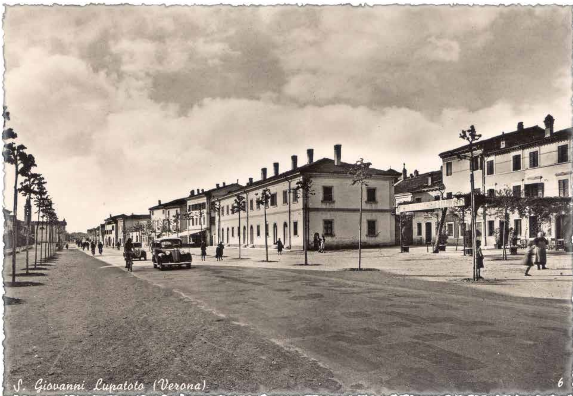
S. Giovanni Lupatoto (Verona)