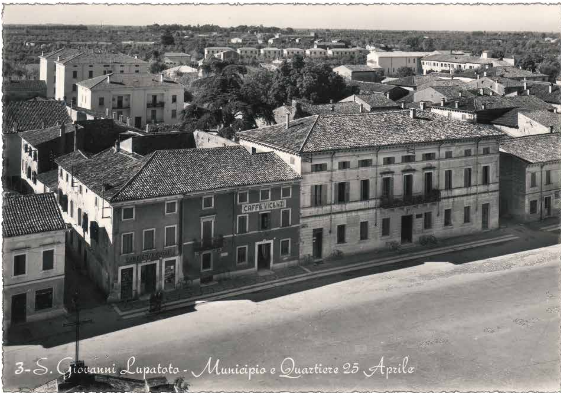
3-S. Giovanni Lupatoto - Municipio e Quartiere 25 Aprile