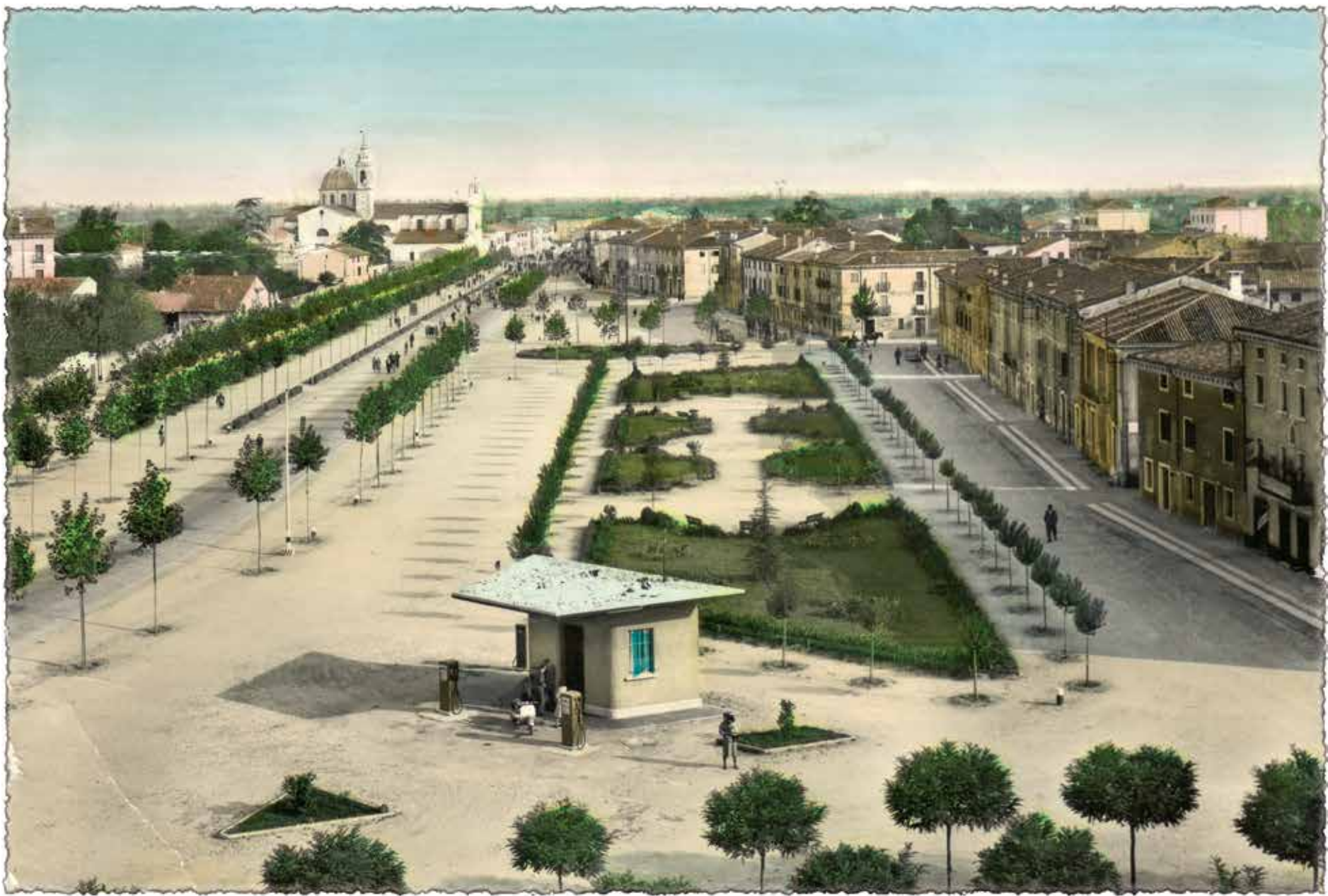
Piazza Umberto I°

La prima sistemazione della piazza risale agli anni 1947/48. In tale occasione furono realizzati i giardini e piantati i platani che fiancheggiano ancora oggi la strada principale e il viale pedonale.