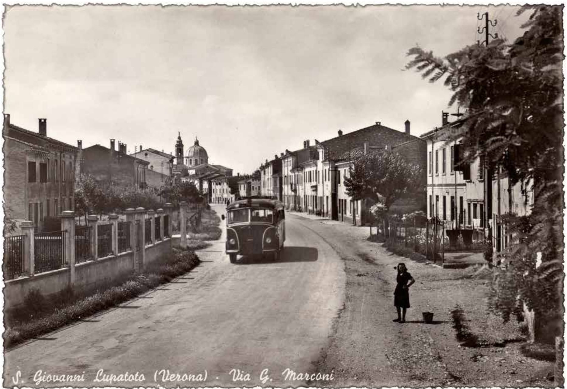
L'Antica frazione del "Casotto"

Non visibile nell'immagine, ma a pochi passi, addossato al muro, di una casa, si trova il capitello della Madonna della Pace (del Casotto). Sotto il capitello, attaccata al muro una palla da cannone ricorda lo scontro avvenuto tra Francesi e Austriaci, in paese, il 5 aprile 1798.