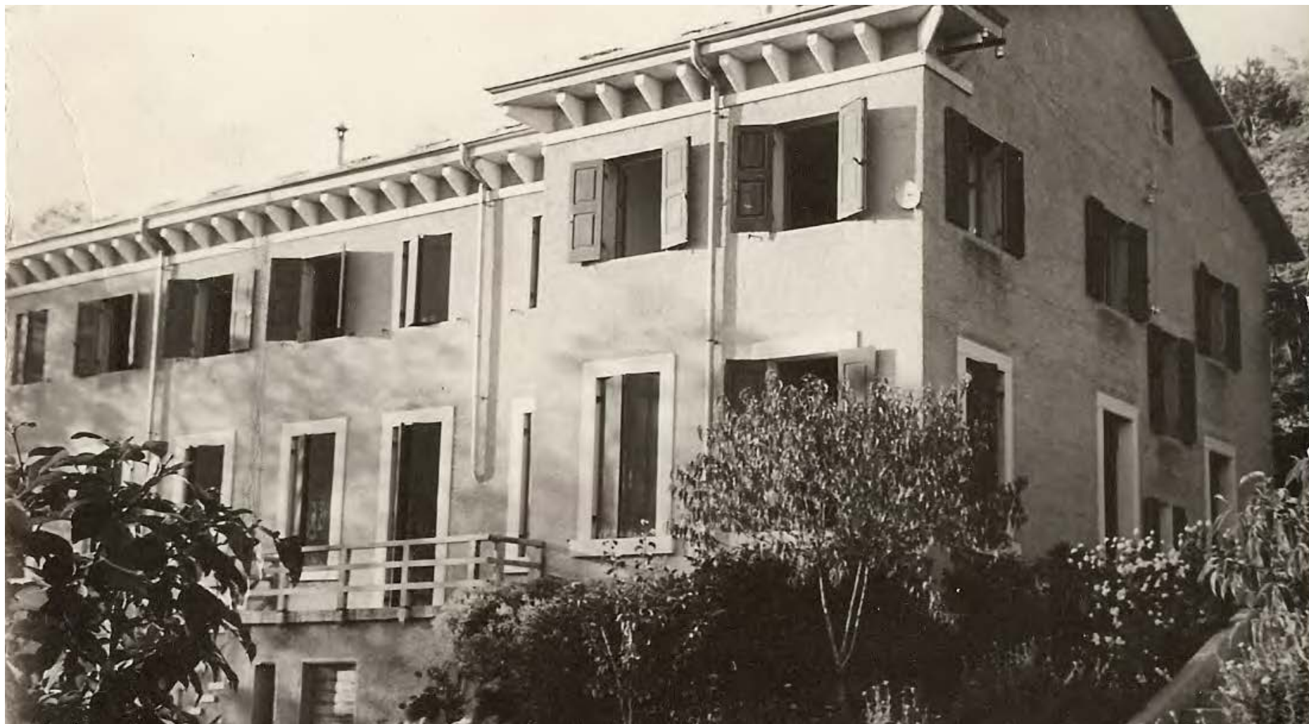
Foto panoramica di Prun

Cronaca della giornata tipo – valore della autonomia fuori da casa