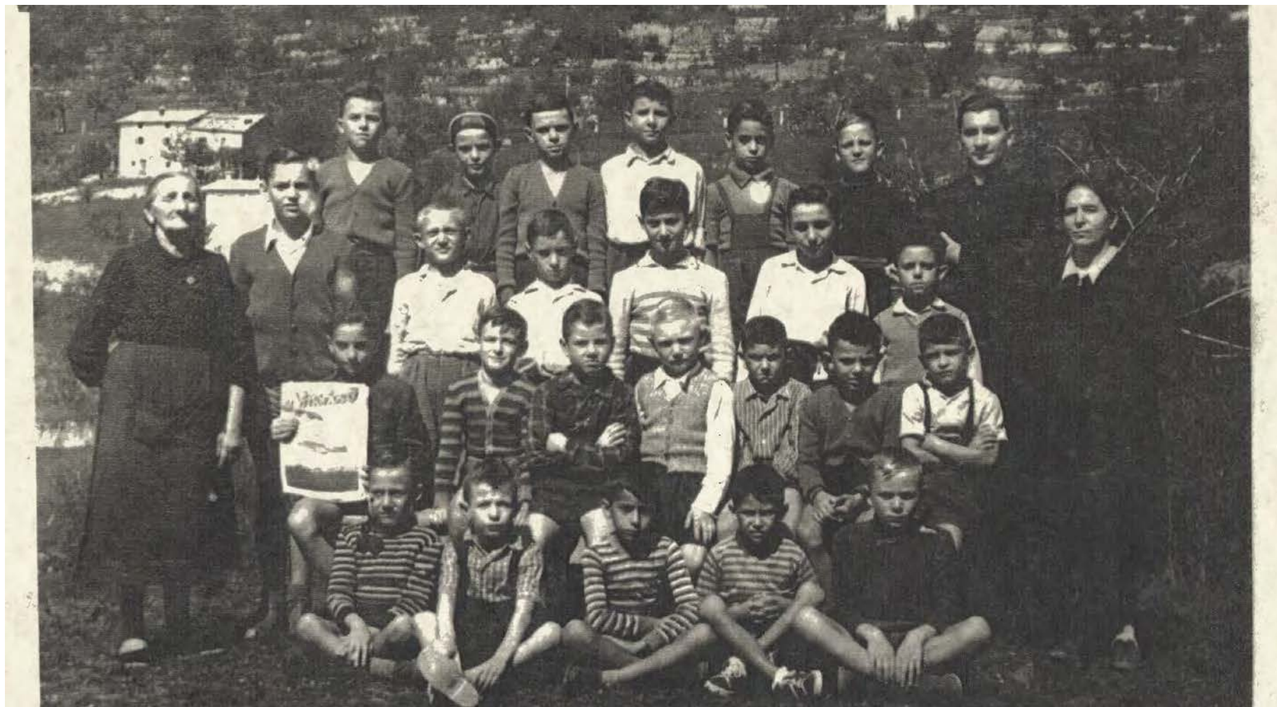
Primi anni: fontana fuori dal recinto e acqua in secchi – servizi provvisori in pineta