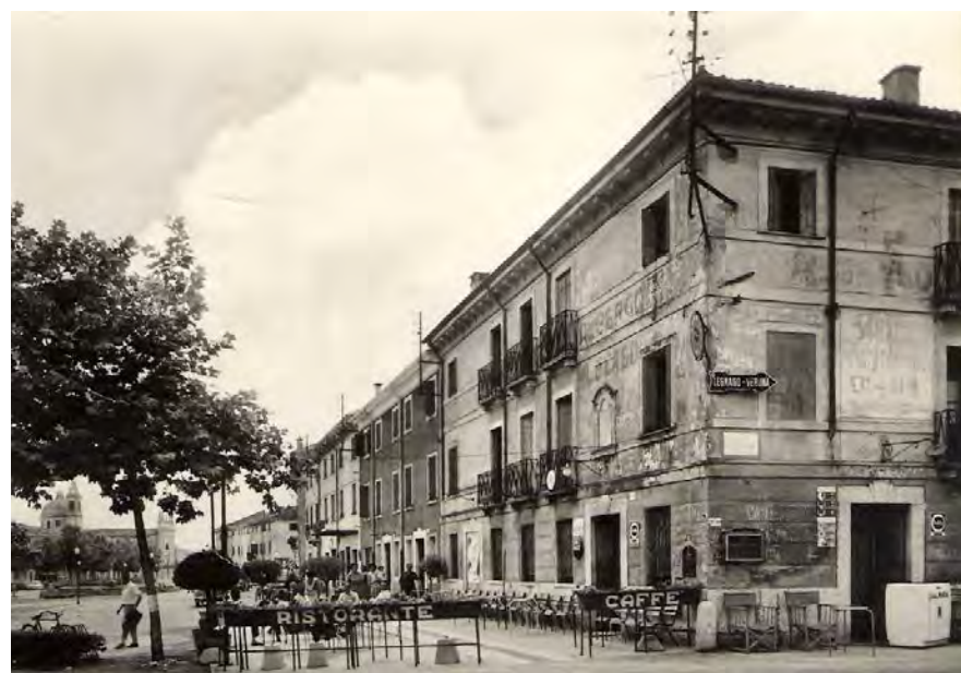
Foto anni '50