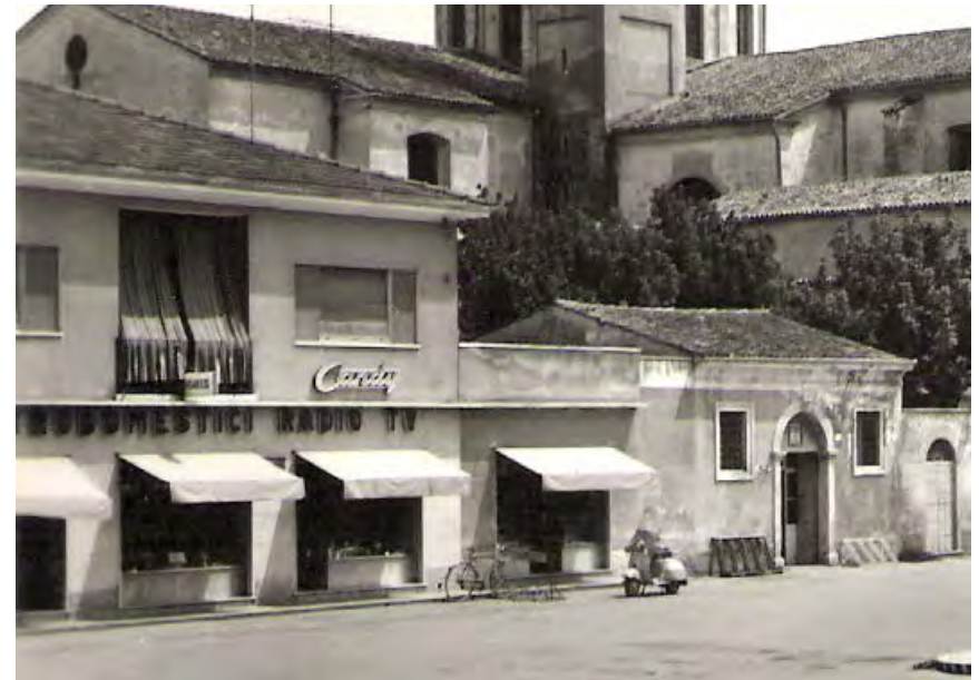
Foto anni '60