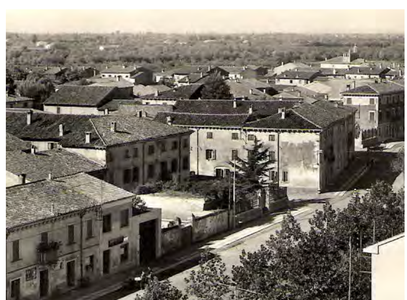
Foto anni '50