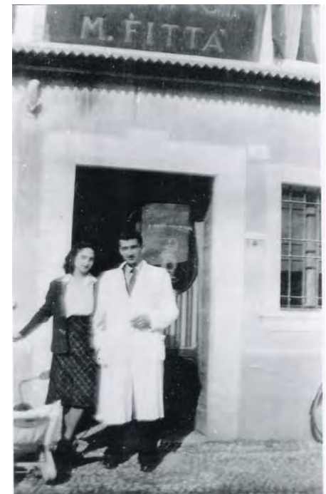
Foto anni '40 La farmacia occupava la sede dell'attuale bar