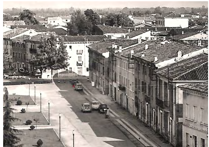
Foto anni '60