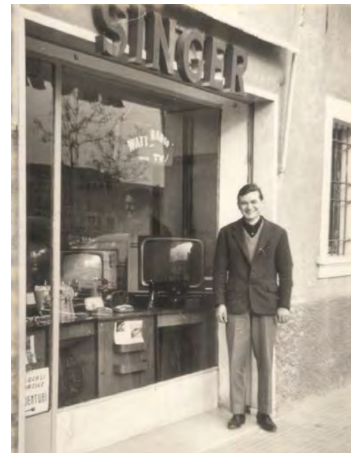
Foto anni '60 riferita al negozio di piazza Umberto I, 63

1962: Negozio di elettrodomestici e macchine da cucire Castagnetti fino al 2006