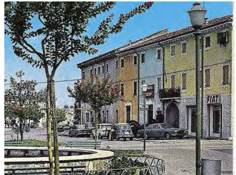
Foto anni '60